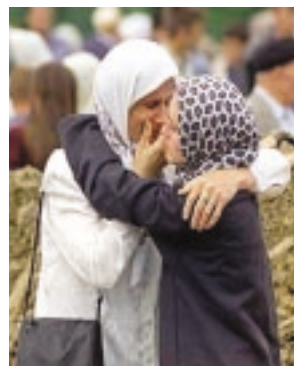
▲ جنگ‌های داخلی یوگسلاوی، که از سال ۱۹۹۱ آغاز شد، بیش از ۸ هزار نفر از مسلمانان به دست صرب‌ها کشته شدند.