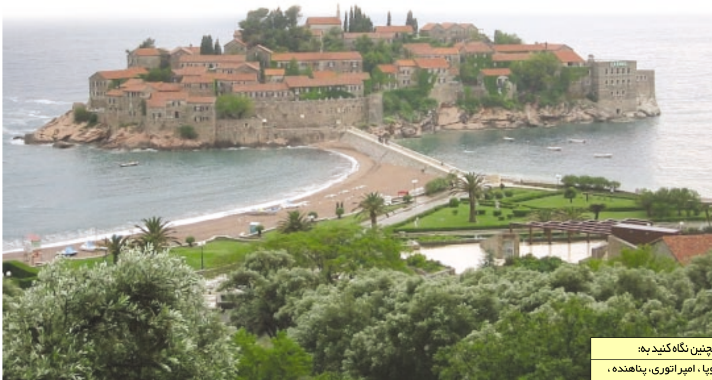
همچنین نگاه کنید به:

▼ سارایوو پایتخت و بزرگ‌ترین شهر بوسنی و هرزگوین است. این شهر یکی از زیباترین شهرهای اروپا و مهم‌ترین شهر منطقه‌ی بالکان به حساب می‌آید. تاریخ ۶۰۰ ساله‌ی این شهر، آن را به یکی از مراکز جهان‌گردی اروپا تبدیل کرده است.