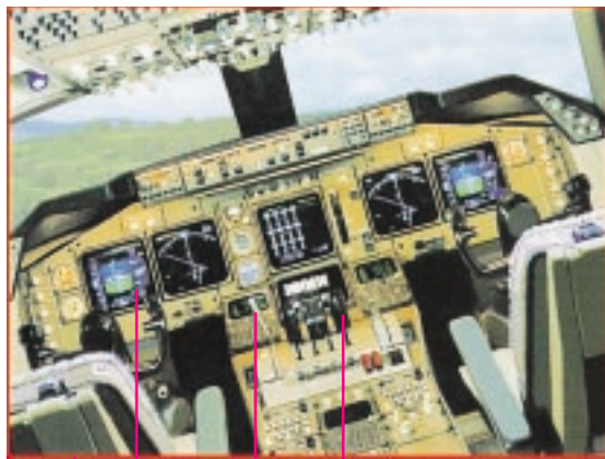
اهرم برای پایین آوردن چرخ‌های فرود

مسافرت‌های طولانی با هواپیماهای جت، ارزان و قابل اعتماد شده است. بوئینگ ۷۴۷ (جیمبو جت) نخستین جت با بدنه‌ی عریض بود. این هواپیما تا ۵۶۰ مسافر را در مسافتی بیش از ۸ هزار کیلومتر جابه‌جای کند. صدها بوئینگ ۷۴۷ با ۹ نوع متفاوت ساخته شده است. بال‌های رو به عقب، در سرعت‌های بالا مقاومت هوا یا نیروی پسا را کم می‌کند. ولی نیروی بالابر را نیز کاهش می‌دهد، در نتیجه، هواپیما برای برخاستن و نشستن، به باندهای طولانی و سرعت زیاد نیاز دارد. همه‌ی هواپیماهای جدید باید قانون‌های زیست‌محیطی و ایمنی را به طور جدی رعایت کنند.